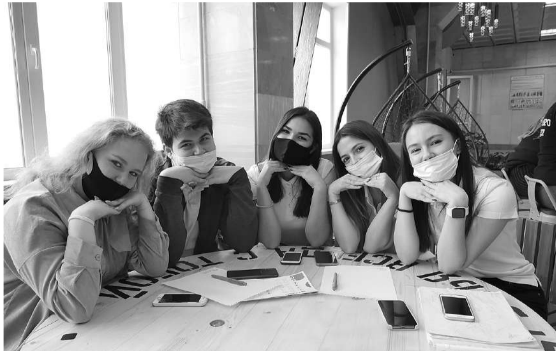
В университете появилось много уютных мест для отдыха и общения студентов

Сегодня мы вернулись к привычному очному формату деятельности, но не забываем онлайн-опыт учёбы и работы, он дал нам новые возможности, в том числе общения с российскими и зарубежными коллегами и работодателями.