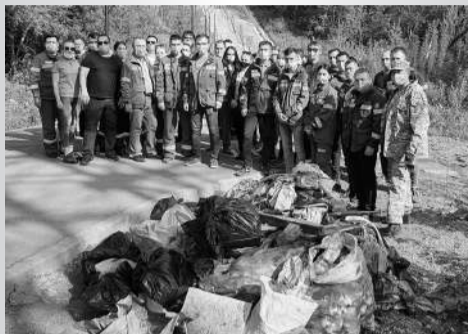
Мусора собрали немало!

Субботник – это прекрасный способ поднятия корпоративного духа, сплочения коллектива, улучшения психологического климата. Субботник создаёт условия для неформального общения и взаимодействия, налаживания коммуникаций, позволяет коллегам лучше узнать друг друга. Ведь ничто так не объединяет людей, как совместный труд для общей пользы.