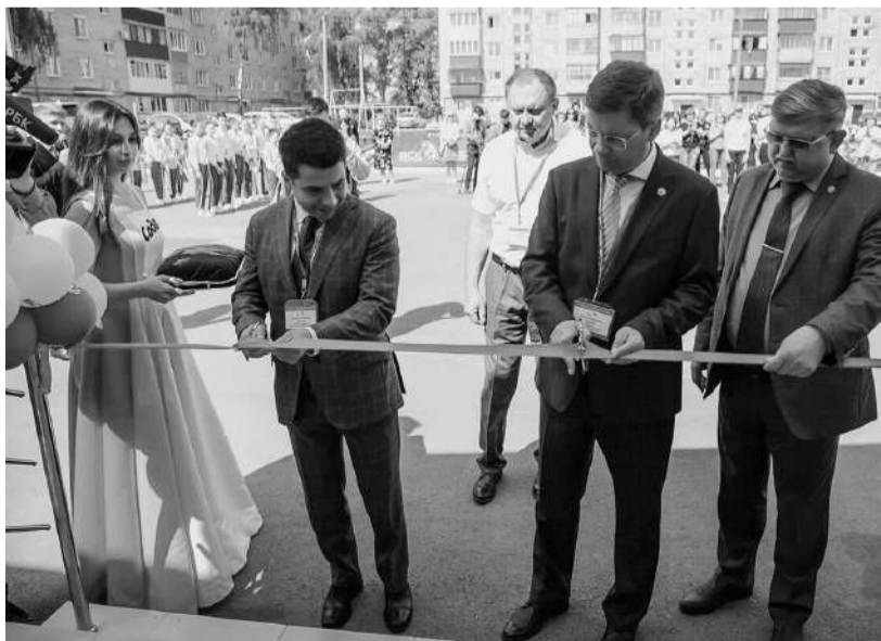
В спортивный центр было вложено около 100 миллионов рублей

Комплекс вмещает в себя просторный игровой зал для групповых занятий и тренажёрную зону, в которой установлены новейшие тренажёры на разные группы мышц. В реконструкцию здания и оснащение залов вложено порядка 100 млн рублей.