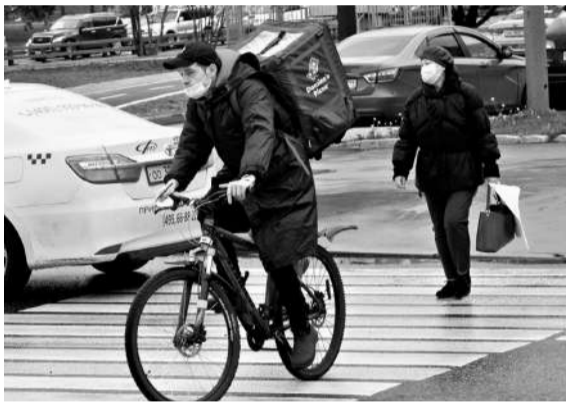
Платформенная занятость входит в наши будни

зации трудового процесса, – говорит Гай Райдер. – Все те вещи, которые мы разрабатывали десятилетиями, чтобы защитить трудящихся, – минимальные зарплаты, часы работы, социальная безопасность, – не обязательно применимы к платформенной экономике. Кто, например, может контролировать количество рабочих часов? У