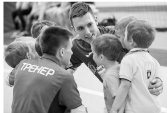
Спорт как элемент воспитания и образования