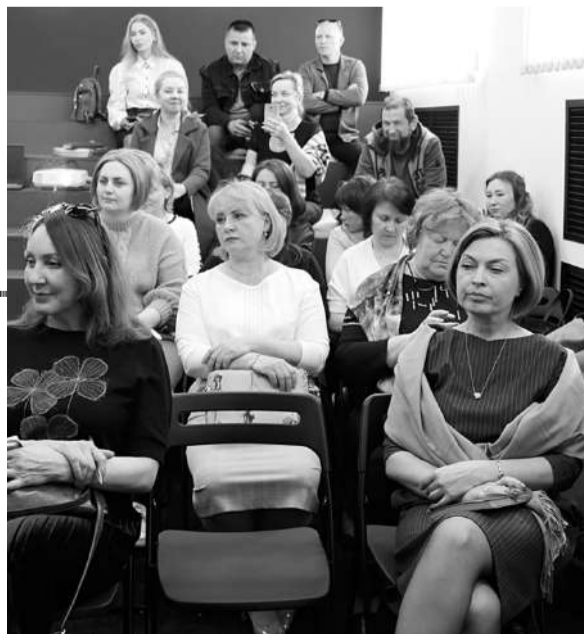
Семинар собрал более 40 участников

ей продукции для участников семинара. Кстати, в конце прошлого года на предприятии была создана первичная профсоюзная организация и был принят коллективный договор.