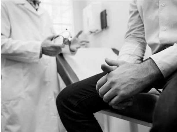
«Доктор, я доживу до пенсии?»

Шутка о том, что в России родилось последнее поколение, которое видео живых мужчин-пенсionеров, оказалась пророческой. Данные по средней продолжительности жизни мужчин по субъектам РФ наглядно показывают, что в половине регионов они не доживают до нового пенсионного возраста в 65 лет. Республика Башкортостан – не исключение, здесь мужчины живут около 64 лет, и по этому показателю мы находимся на 50-м месте в стране.